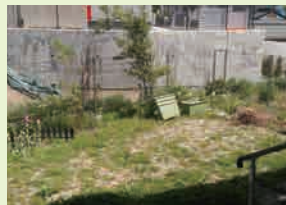
この庭でどんな野菜が実るのか、今から楽しみです♪

サ高住では、今年も敷地内のスペースを使って、植物を育てたり菜園を楽しむことにしました。まずは、職員が自宅で育てている花の苗や種のお裾分けを貰って、施設の入り口にお花畑を作りました。すると、このお花畑を部屋から眺めていたご利用者が自ら率先して花の水やりをしてくださる、と