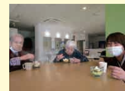
プリンアラモードを作りました。