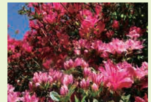
正面玄関前のつつじも見頃を迎えています。